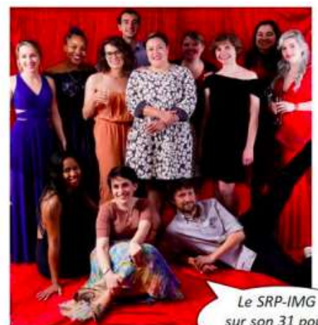
Le SRP-IMG sur son 31 pour son Gala!

A très bientôt, L'équipe du SRP-IMG Syndicat Représentatif Parisien des Internes de Médecine Générale